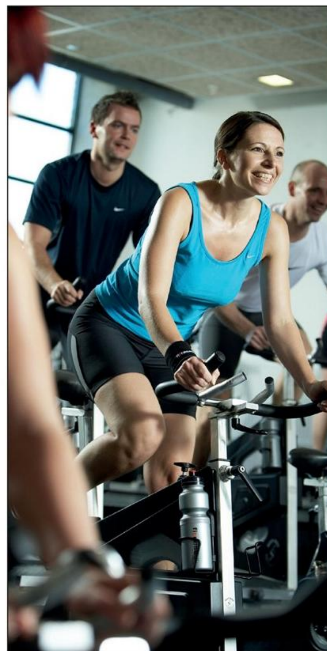
Kunderne kan træde i pedalerne med god samvittighed, for fitness.dk prioriterer CO 2 -reduktion.

MASTER LED LV 7W er Lumieres mest populære LED-lyskilde til virksomheder, der ligesom fitness.dk kan spare på både udgifter og CO 2 ved at skifte lyskilder.