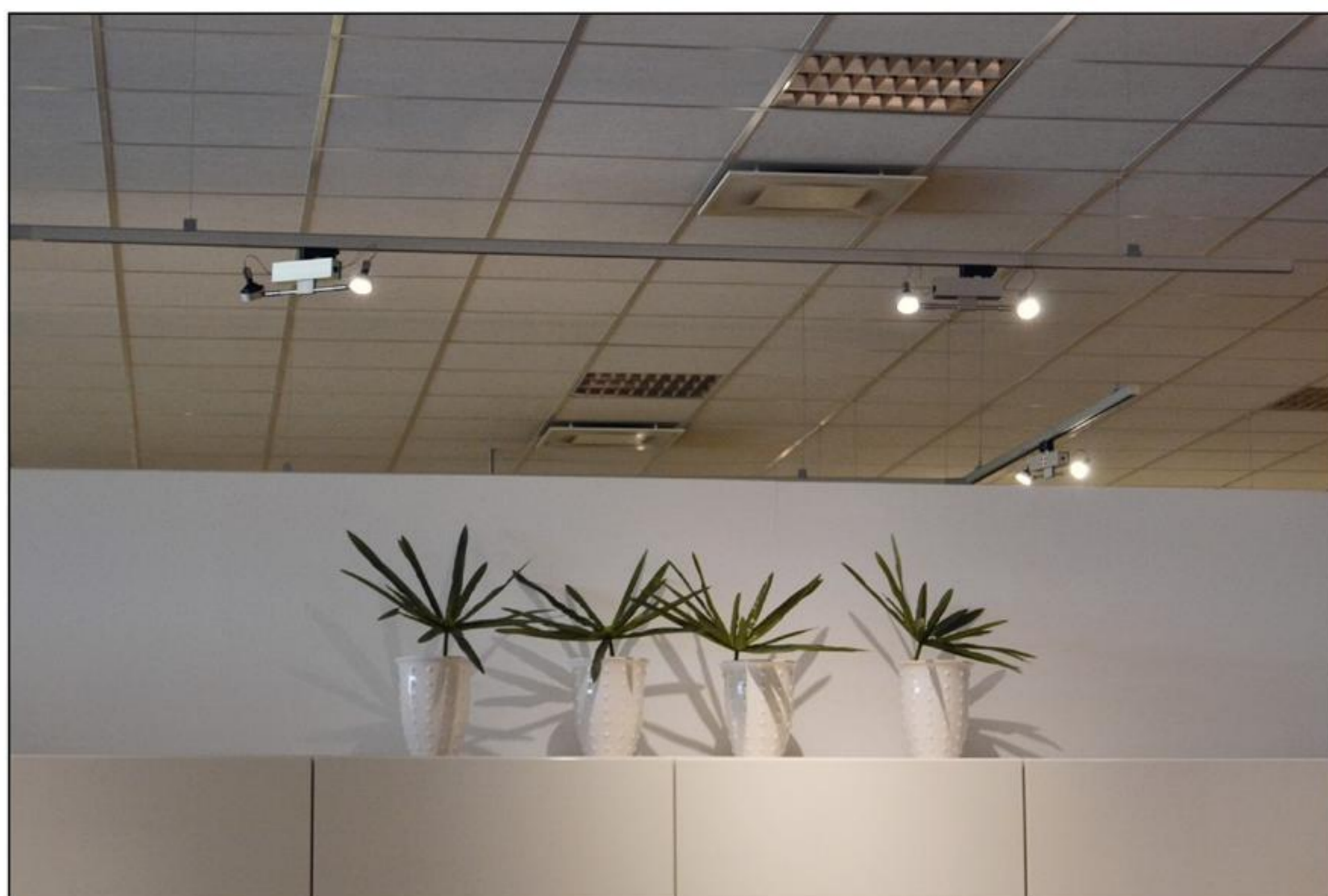
Forsyningselskabet Tre-For tilbyder gratis at analysere forretningernes forbrugskilder og adfærd med fokus på belysning, varme og ventilation.

- Butikken etablerer en »klimakredit« i Middelfart Sparekasse, hvorpå der blot løbende indbetales et beløb