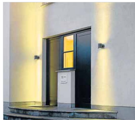
LED kan bruges både ude og inde.

res for hver watt strømforbrug. Her anbefaler centret en værdi på mindst 50 for lyskilder og 40 for komplette armaturer.